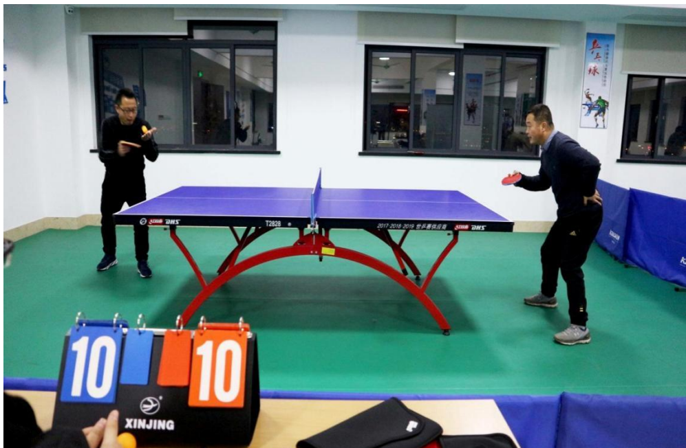
图3 员工业余文化生活一角

公司十分重视员工的精神健康，经常性地开展丰富多彩员工文体活动，调动员工的工作激情，丰富员工的业余生活，获得了员工的广泛好评，提升了员工对企业文化的认同感、归属感，提高了公司的凝聚力。